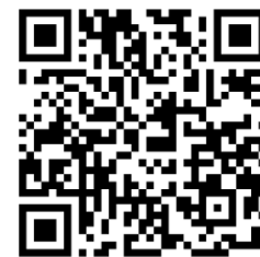
Tracé de la Voie