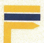
Changement de direction à droite