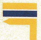
Changement de direction à gauche