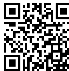
Tracé de la voie

Le choix de ce parcours vous permettra de découvrir la belle et réputée région viticole du Médoc tout nouvellement labellisée « Parc naturel régional du Médoc », et d'aborder ainsi la banlieue bordelaise par une agréable coulée verte tout en vous faisant économiser des kilomètres.